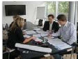
IV. Umsetzung in der Praxis