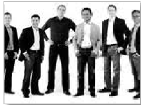
I. Videoaufzeichnung einer Team- Arbeitssitzung