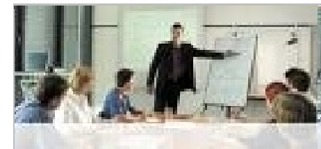
Zweite Videoaufzeichnung, Analyse und Workshop