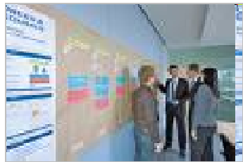
III. Workshop mit dem Team